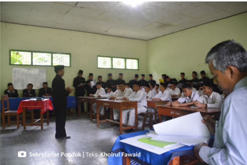
Sekretariat Pondok | Teks: Khoirul Fawaid