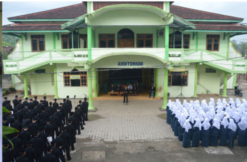
Kiri: Salah satu santri kelas VI Tarbiyatul Mu'allimin al-Islamiyyah sedang melaksanakan 'Amaliyah Tadris/ praktik mengajar Kanan: Apel Pembukaan 'Amaliyah Tadris/ praktik mengajar di depan auditorium Pondok Pesantren Wali Songo Ngabar

Pondok Ngabar merupakan sebuah lembaga pendidikan Islam yang menerapkan sistem utama pendidikannya untuk mencetak seorang "Guru". Hal ini jelas termaktub pada nama tingkat pendidikan menengahnya yaitu Tarbiyatul Mu'allimin wal Mu'allimat Al-Islamiyah. Guru yang dimaksud disini ialah bahwa profesi apapun yang nantinya akan dijalani oleh seluruh alumni Ngabar hendaklah ia tetap 'mengajar'. Pedagang yang mengajarkan kejujuran, Hakim yang mengajarkan keadilan, Polisi yang mengajarkan kedisiplinan, dan lain sebagainya.