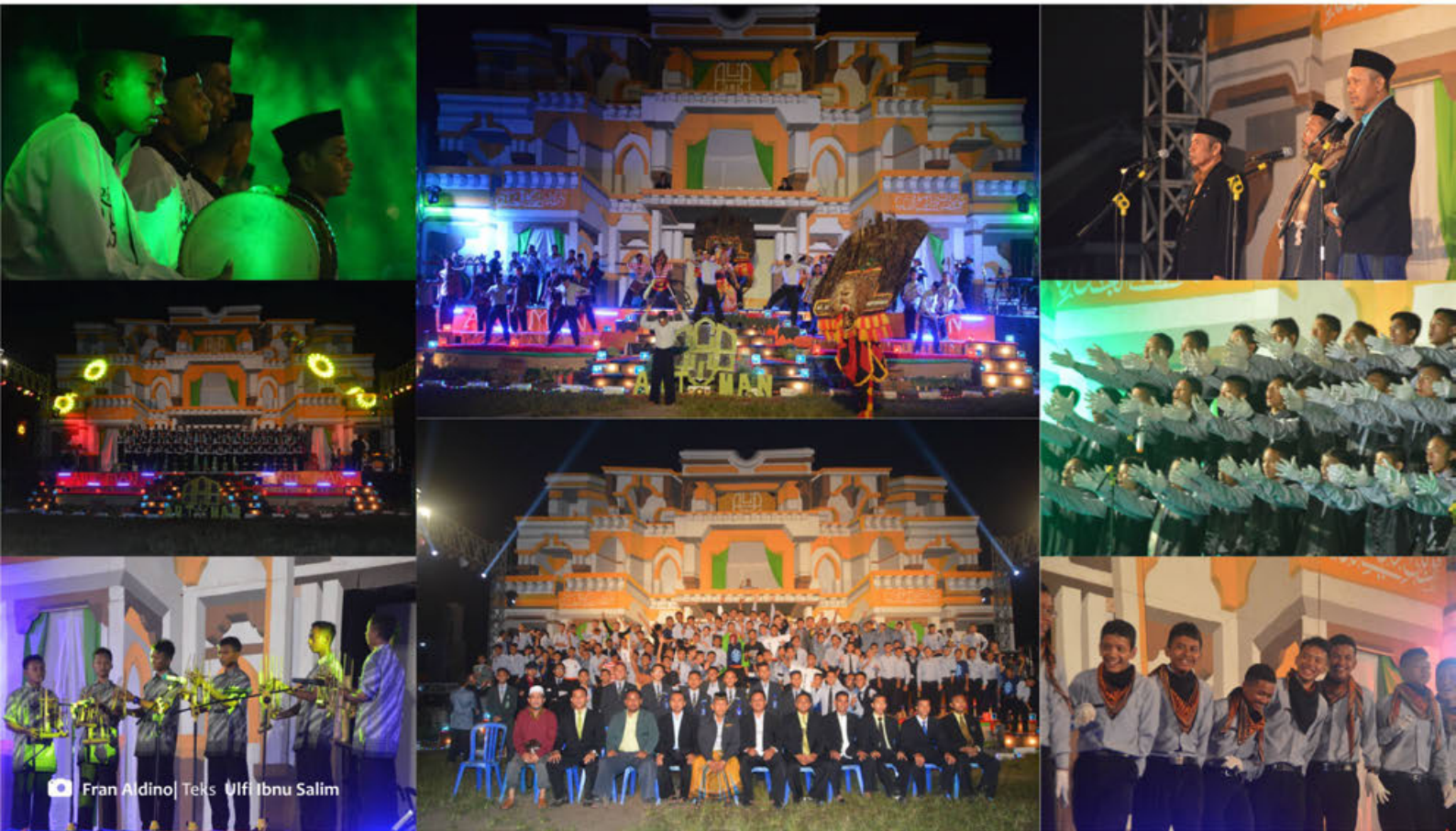
▶ Santri kelas IV dan III Intensif Tarbiyatul Muallimin al-Islamiyyah dalam pentas seni Art Collaboration Performance 2017

A rt Collaboration Performance atau biasa disebut dengan Art Man, adalah pentas seni tahunan yang dilaksanakan oleh santri kelas IV dan III intensif sebagai wadah mengekspresikan kemampuan diri dan berlatih organisasi. pada tahun ini Art Man dilaksanakan di lapangan hijau ngabar, karena masjid sedang mengalami renovasi.