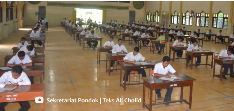
Sekretariat Pondok | Teks Ali Cholid

Ujian akhir Tahun TMI di Auditorium (ilustrasi)