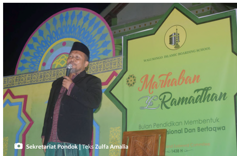
Sekretariat Pondok