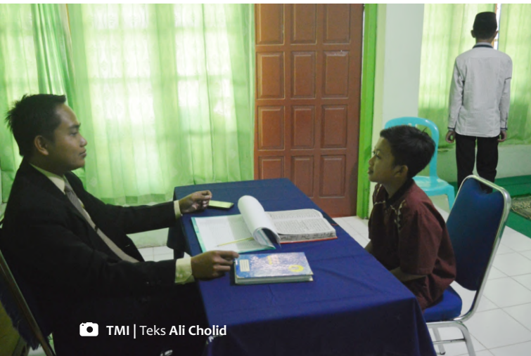
TMI

▶ Calon santri baru TMI sedang mengikuti ujian seleksi