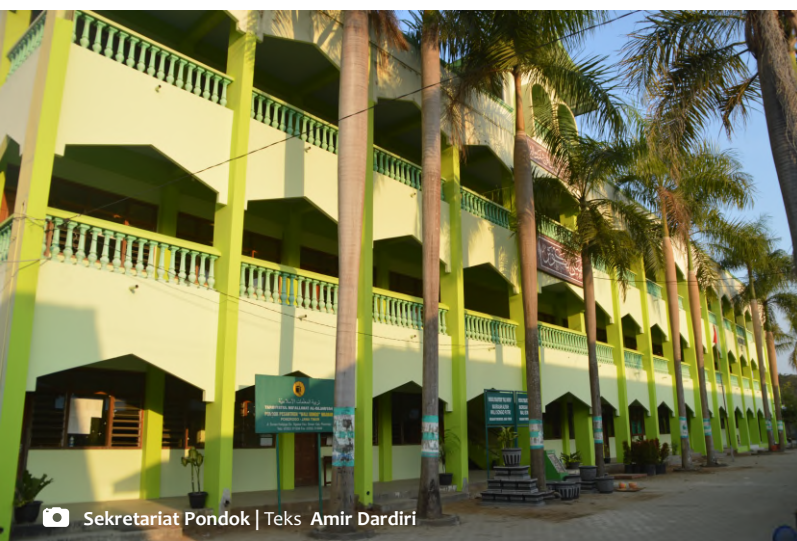
Sekretariat Pondok | Teks Amir Dardiri

Tujuan diadakannya acara ini adalah sebagai bentuk syukur dan silaturahmi saat libur