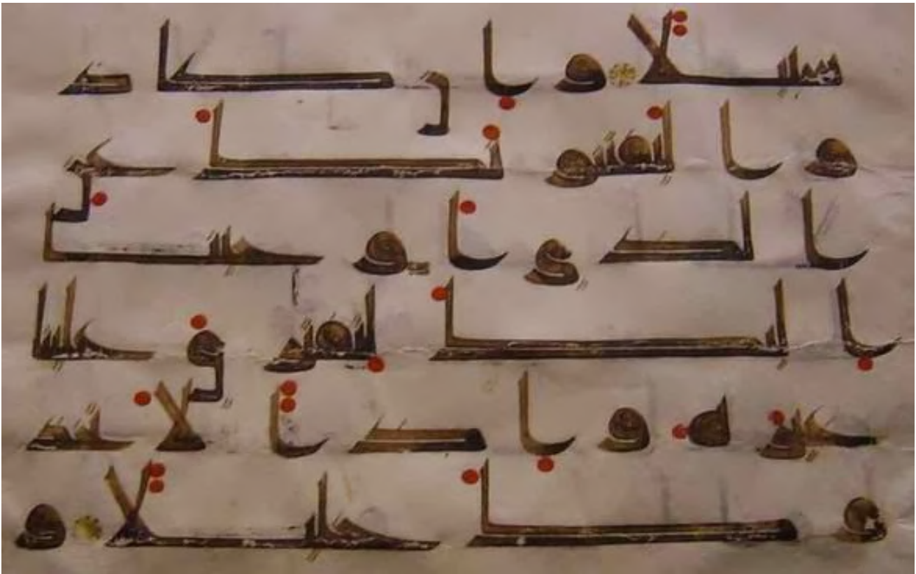
Salah satu contoh harakat dengan titik yang dirumuskan oleh Abu Al-Aswad Ad-Du'ali

merubah makna yang sangat dalam, dan hal itu tentu sangat berbahaya bagi kesucian al-Qur'an dan kelanggengan bahasa Arab.