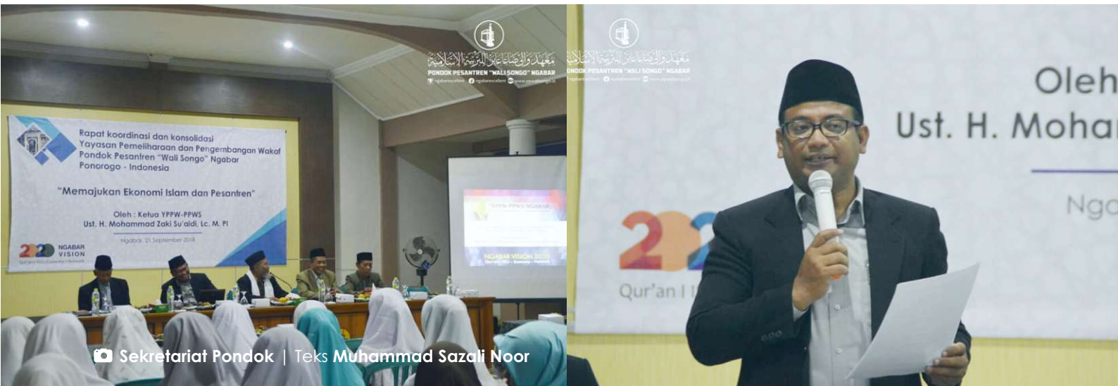
Teks Muhammad Szali Noor

▶ YPPW-PPWS mengadakan rapat koordinasi untuk memajukan ekonomi Islam dan pesantren.