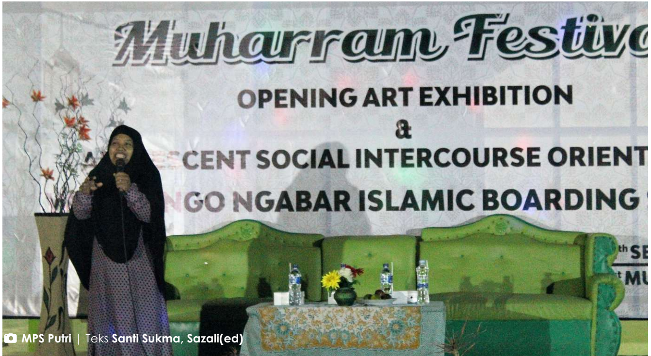
MPs Putri | Teks Santi Sukma, Sazali(ed)

► Acara 1 Muharram di kampus putri Pondok Ngabar