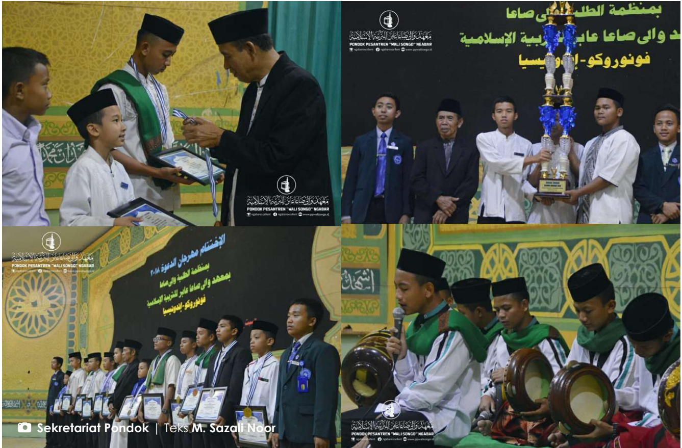
► Suasana penutupan Gebyar Dakwah 2018 Tarbiyatul Mu'allimin al-Islamiyyah

Pondok Ngabar –Santri kelas 4 dan 3 Intensif meraih juara umum Gebyar Dakwah 1440 H / 2018 M. Acara yang berlangsung selama 8 hari (15-22/9) ini dilaksanakan di area kampus putra Pondok Pesantren “Wali Songo” Ngabar.