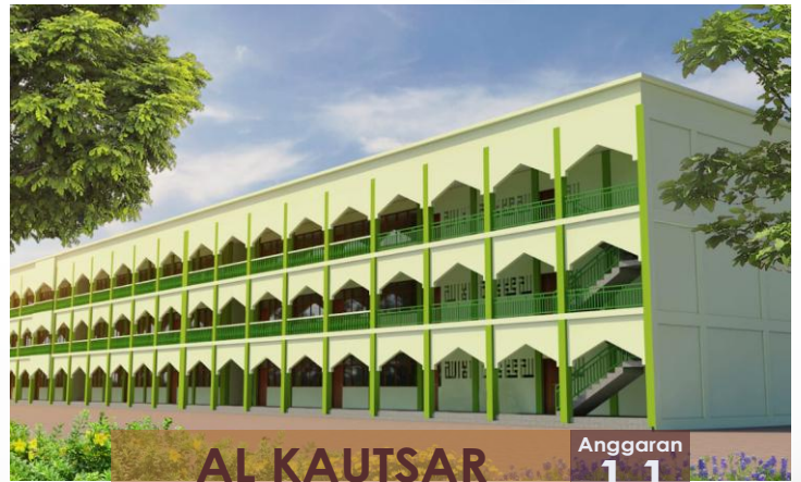
AL KAUTSAR Pembangunan Tahap III

Pembangunan Gd. Sunan Ampel Tahap II ini, memiliki 2 lantai terdiri dari 10 ruangan, setiap ruangan didesain memiliki ruang yang luas dan nyaman sehingga mampu menampung hingga 35 santri. Jika digabungkan dengan bangunan awal, maka jumlah keseluruhannya ada 18 ruangan. Besar harapan dengan dibangunnya Gd. Sunan Ampel Tahap II ini, mampu memberikan fasilitas lebih kepada seluruh santri sehingga merasa lebih nyaman.