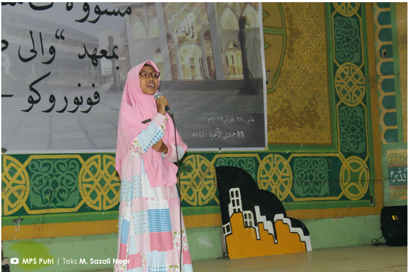
Teks M. Sazali Noor

Salah satu peserta finalis Audisi Daiyah menyampaikan pidatonya.