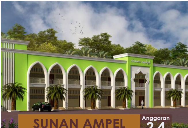
SUNAN AMPEL Pembangunan Tahap II

Gd. Sunan Ampel Tahap II | Gd. Al Kautsar Tahap III