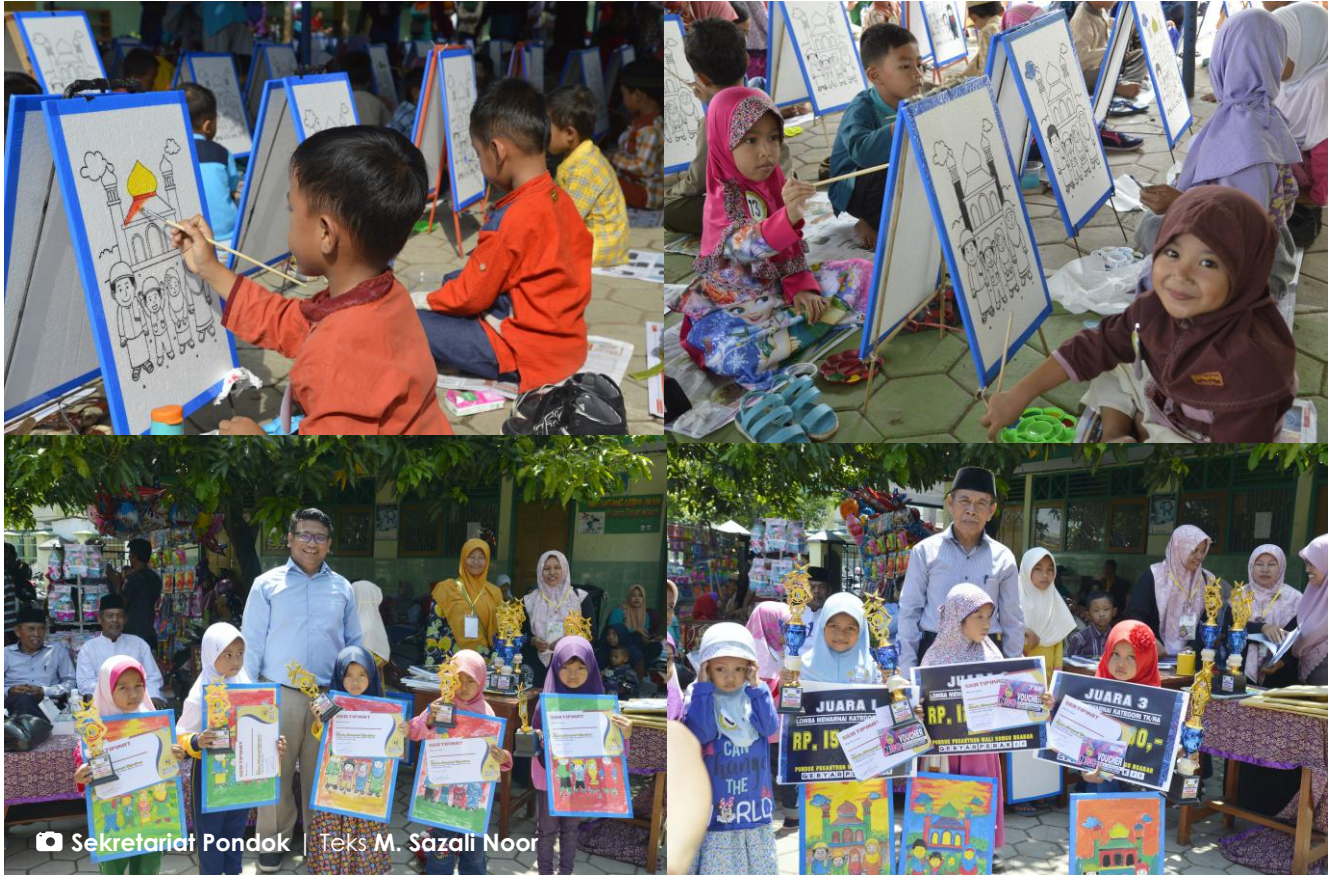
Anak-anak mengikuti lomba mewarnai dengan riang gembira

Pondok Ngabar - Kesenangan lomba mewarnai tingkat TK/PAUD se-Kabupaten Ponorogo pada Jum'at (22/3) terlihat di halaman MI Mamba'ul Huda Pondok Ngabar. Lomba ini diselenggarakan oleh alumni ke-28 Pondok Ngabar yang diikuti sebanyak 156 peserta dari PAUD dan TK se-Kabupaten Ponorogo. Kegiatan lomba mewarnai ini merupakan rangkaian kegiatan dalam menyemarakkan milad Pondok Ngabar yang ke-58.