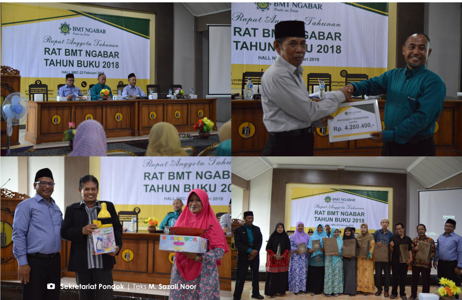
Teks M. Sazali Noor

► Suasana Rapat Anggota Tahunan (RAT) II BMT Ngabar di Aula NBC, Jumat (22/2)