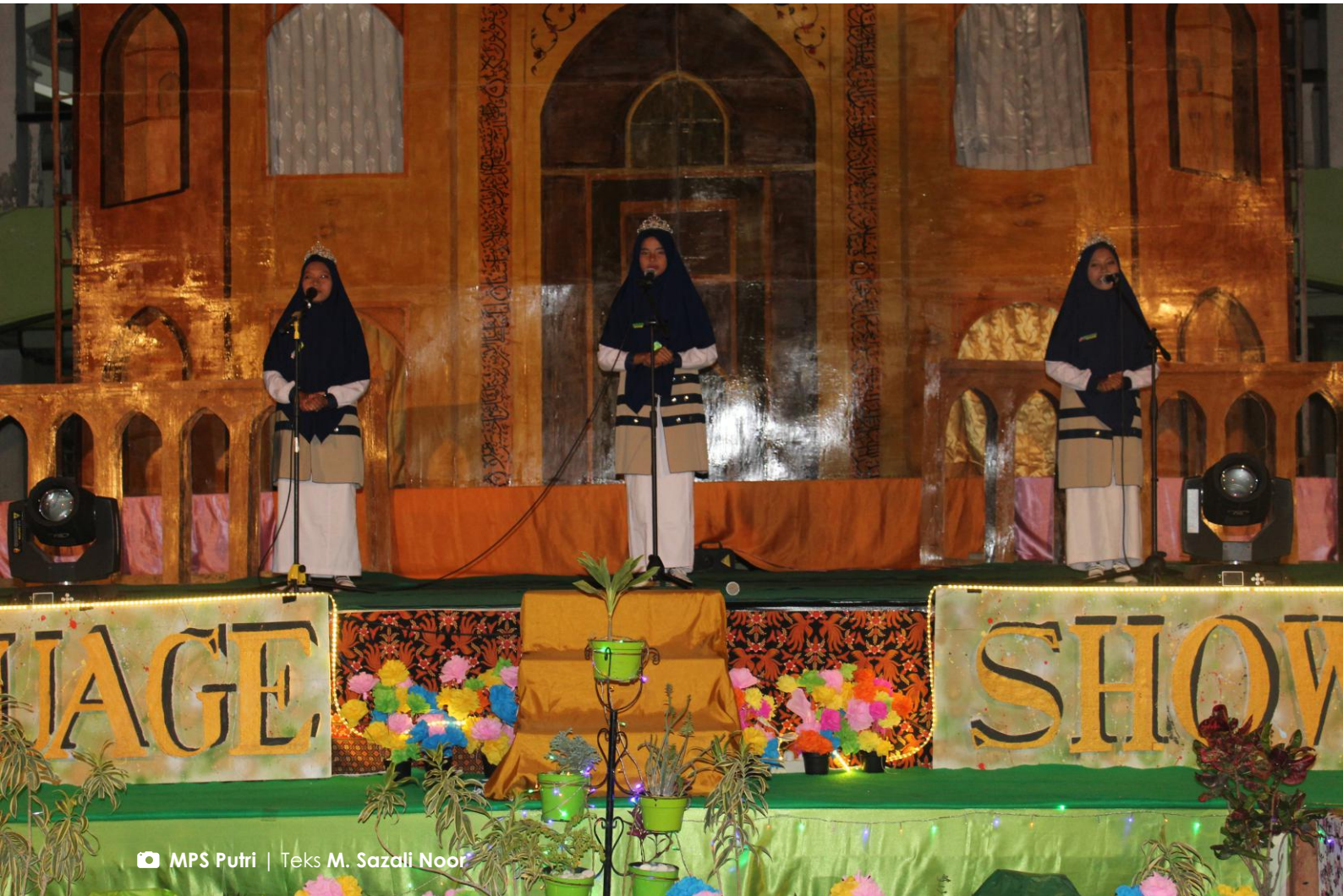
► MPS Putri | Teks M. Sazali Noor

► Language Show sebagai ajang unjuk kreativitas santri putri dalam berbahasa asing